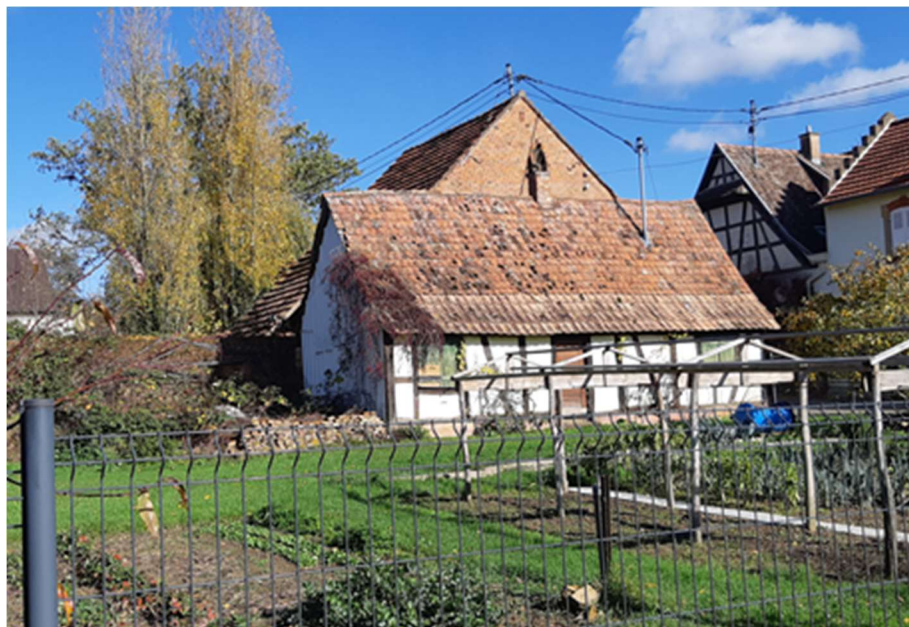
Coté jardin .