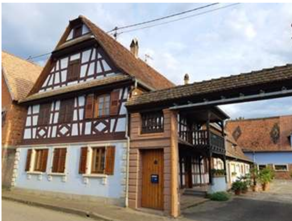
Vue générale de la maison d'habitation.