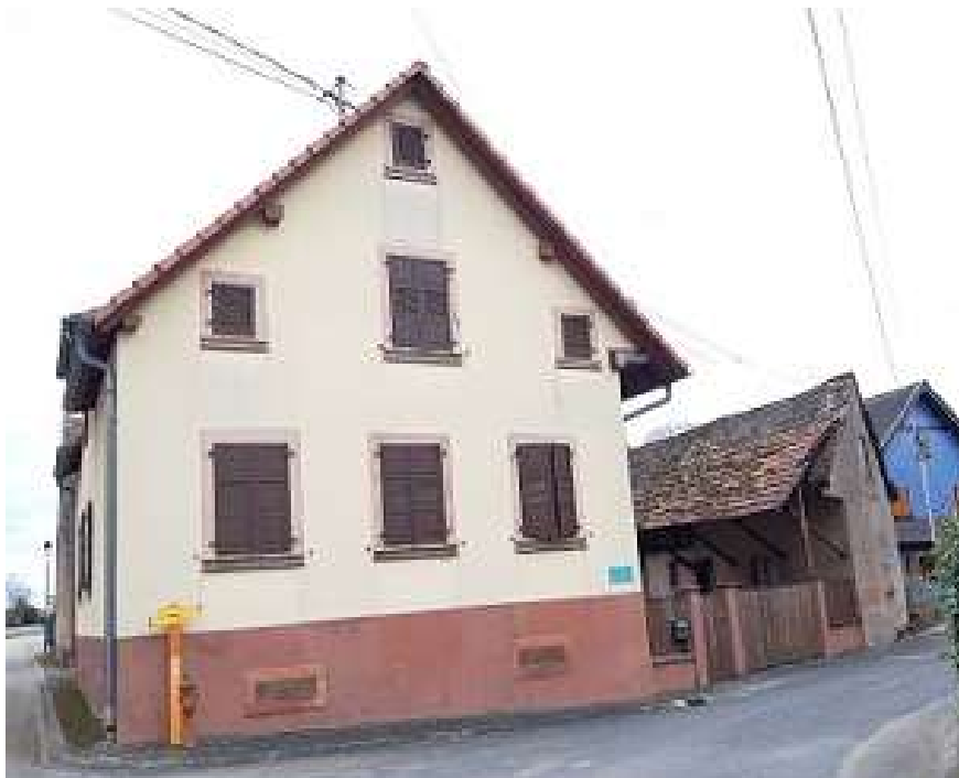
S'Moeschorsche avant la récente déconstruction des dépendances.