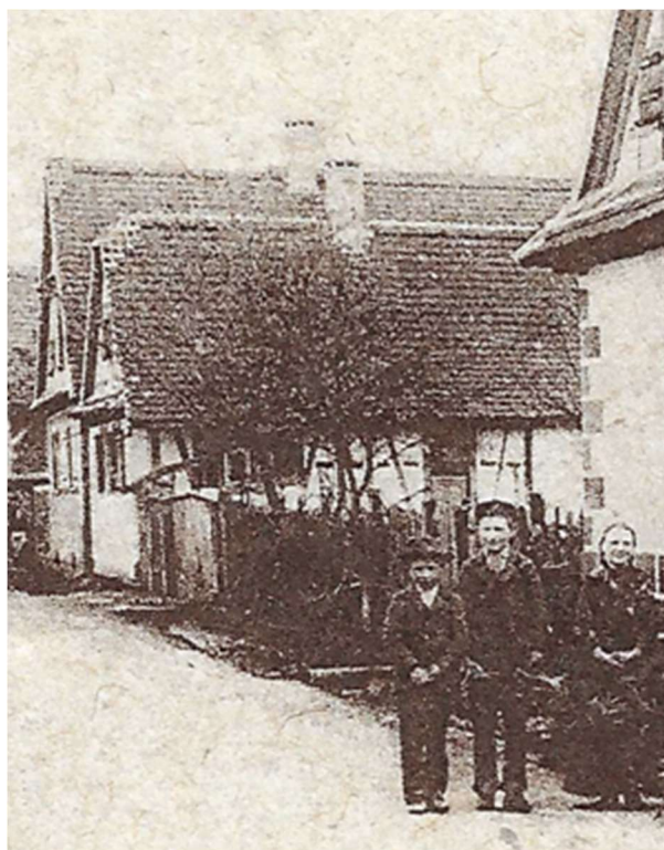
Image extraite d'une carte postale datant des environs de 1900.