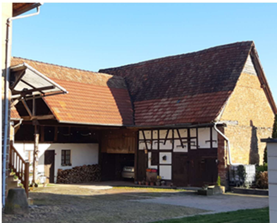
Seule la grange située à l'arrière semble ne pas avoir été remaniée depuis l'origine.