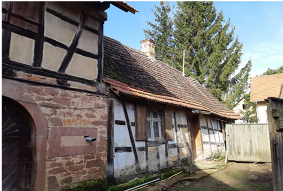
Dans la cour.