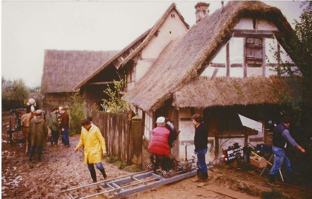
Préparatifs pour la prise de vue : on remarque le toit recouvert de chaume et la boue sur le chemin.

Pour en recréer l'ambiance, l'intérieur de la maison a été entièrement passé à la chaux, le toit recouvert de chaume et la rue transformée en borbier par ajout de terre que la pluie a rendu bien collante.