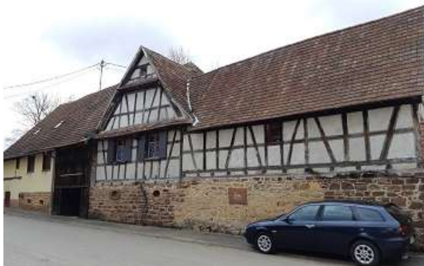
Les dépendances construites le long de la route vers Zæbersdorf ont largement dépassé la parcelle 433 initiale.