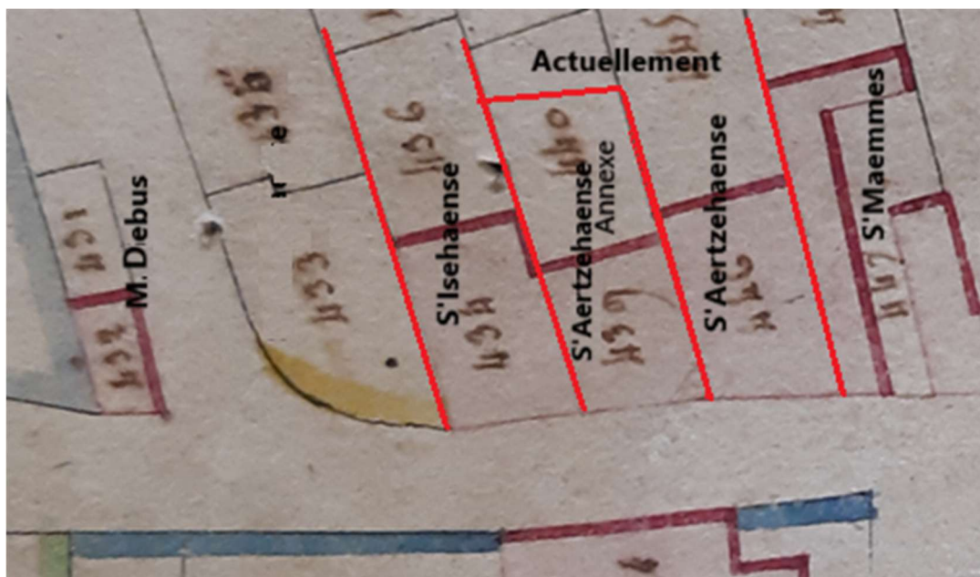
Extrait du plan cadastral de 1826.

Le plan cadastral de 1827 fait apparaître quatre bandes de terrain de largeur équivalente à partir de S'Maemmes jusqu'à la route de Zœbersdorf. Constatant que S'Mayerhaense n'existait pas à l'époque, il faut conclure qu'une petite ferme était intercalée entre les actuels S'Isehaense et S'Aertzehaense . On la désignera par « S'Aertzehaense Annexe ».