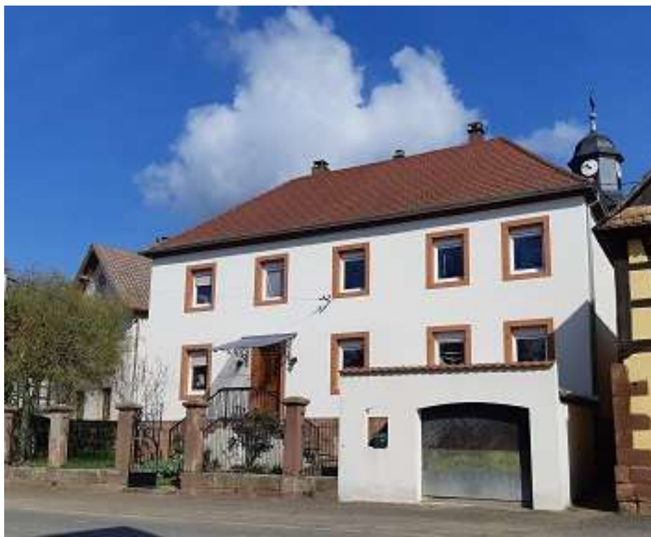
Avec le pignon de l'école (printemps 2022).

Au début du 19 e siècle, la communauté protestante de Wickersheim était encore une annexe de la paroisse de Ringendorf . Lorsque la commune est devenue le siège d'une paroisse regroupant les villages de Wickersheim, Wilshausen et Geiswiller, un logement pour le pasteur et sa famille devenait indispensable.