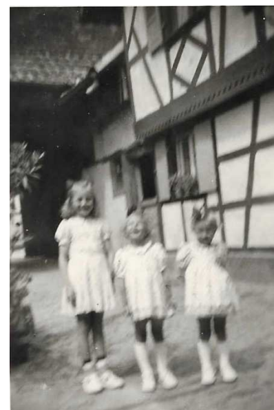
La maison d'habitation vue de la cour, au fond le portail est ouvert.

Seuls subsistent, dans le fond, la grange aménagée en logement, le bâtiment qui a abrité l'épicerie sur la droite et, donnant sur la rue, le garage du tôle Peugeot bleu utilisé pour la tournée de l'épicier.