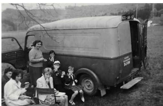
Le tôle au cours d'une sortie dominicale.

La maison d'habitation située sur la gauche et l'entrée couverte, fermée par un grand portail, ont disparu lors de la rénovation