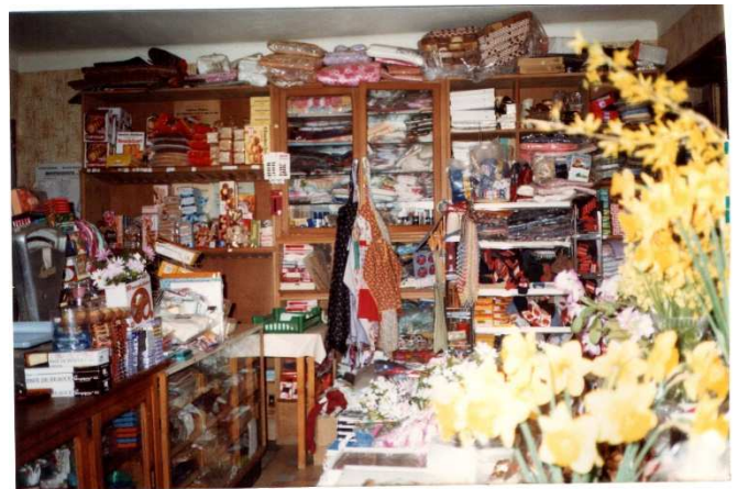
Collection personnelle de Denise Kern-Laester ... derrière le comptoir